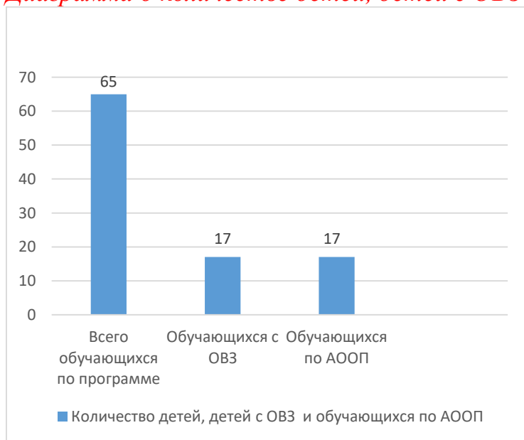
Диаграмма о количестве детей, детей с ОВЗ и обучающихся по АООП